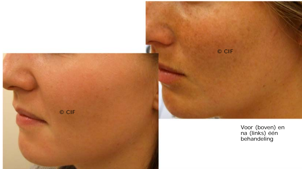
Voor (boven) en na (links) één behandeling

Vanaf de dag nadat u met de behandeling bent begonnen, kunt u onze 100% minerale make-up gebruiken.